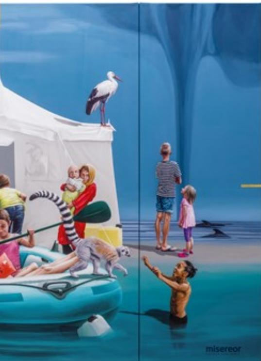
träumen -Liebe sei Tat! von Konstanze Trommer © Misereor

Wort konzentrieren konnten. Es wurde mit den Augen gefastet. Die alte Redewendung „am Hungertuch nagen“ geht hierauf zurück und