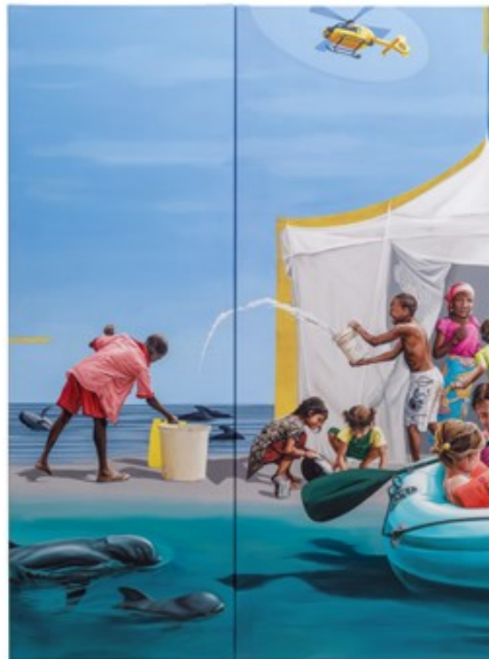
Das Misereor-Hungertuch 2025 "Gemeinsam

Die Tradition der Fastentücher reicht bis ins Mittelalter zurück: Während